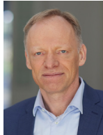
Prof. Dr. Dr. h.c. Clemens Fuest