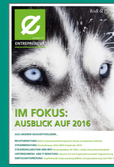
Ausblick auf 2016