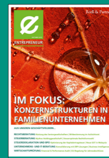
Konzernstrukturen in Familienunternehmen