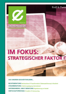
Strategischer Faktor IT