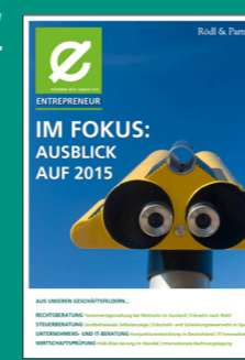
Ausblick auf 2015