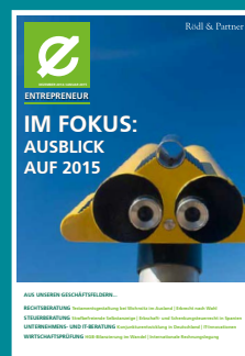
Ausblick auf 2015