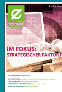
Strategischer Faktor IT