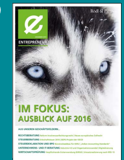
Ausblick auf 2016