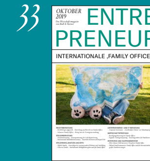
Internationale ‚Family Offices‘