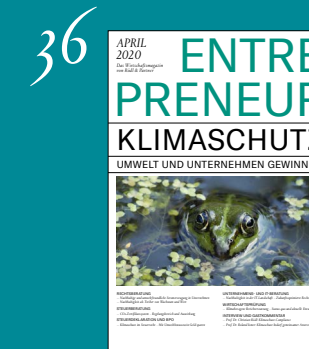
Klimaschutz – Umwelt und Unternehmen gewinnen