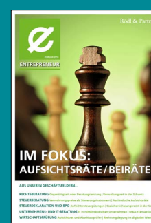
Aufsichtsräte / Beiräte