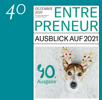
Ausblick auf 2021