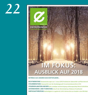
Ausblick auf 2018