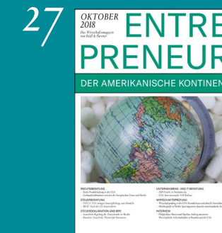
Der Amerikanische Kontinent