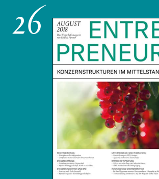
Konzernstrukturen im Mittelstand