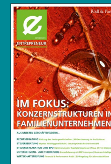
Konzernstrukturen in Familienunternehmen