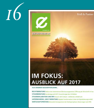
Ausblick auf 2017