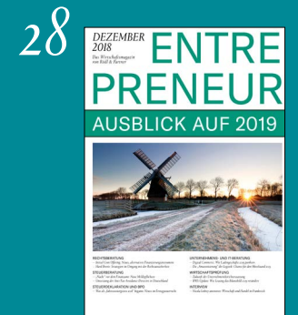
Ausblick auf 2019