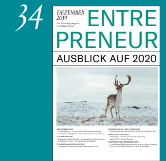
Ausblick auf 2020