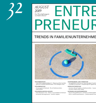
Trends in Familienunternehmen