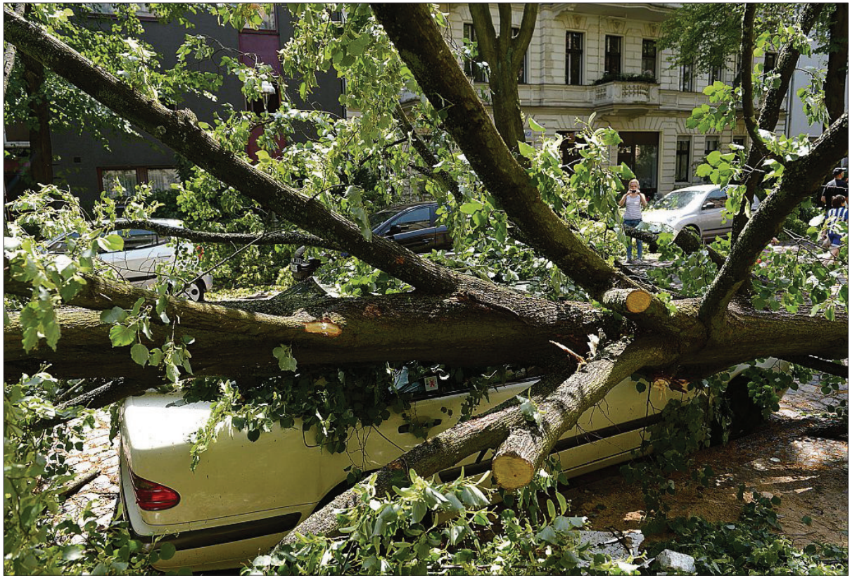
Für Kommunen kann eine unzureichende Pflege von Bäumen, die im öffentlichen Raum stehen, zu schwerwiegenden Rechtsfolgen führen, wenn beispielsweise durch herabbrechende Äste oder umstürzende Bäume Personen- oder Sachschäden verursacht werden.

Nach der Rechtsprechung des BGH hat der für Bäume auf öffentlichen Grundstücken Verantwortliche die Bäume regelmäßig zu kontrollieren, um drohende Schäden und Gefahren für Dritte zu erkennen und zur Schadensvermeidung die erforderlichen Sicherungsmaßnahmen durchzuführen. Der BGH verlangt, dass die Kontrollen in regelmäßigen Zeitabständen vorgenommen werden und bei Feststellung von Gefahren die objektiv erforderlichen und zumutbaren Maßnahmen zu treffen sind (BGH, III ZR