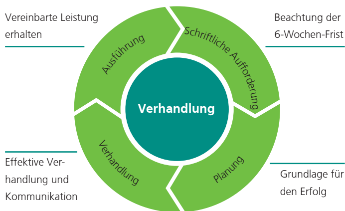
Abbildung 2 Verhandlungsaufbau

Tag des Zugangs dieser Aufforderung bei der anderen Partei. Es muss sich um ausdrückliche Aufforderungen zu Verhandlungen handeln; eine Übersendung von Leistungsbeschreibungen, die Überlassung von Entgeltblättern o.ä. genügen nicht, um eine Frist in Gang zu setzen, sofern damit nicht ausdrücklich eine schriftliche Aufforderung zur Verhandlung verbunden ist. Angestrebt wird mit der 6-Wochen-Frist eine raschere Konfliktlösung, soweit sich die Vertragsparteien über die Pflegesätze und die Vergütung für Unterkunft und Verpflegung in der Einrichtung nicht verständigen können.