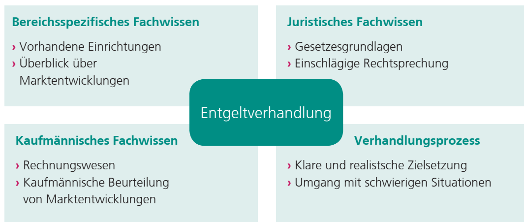
Abbildung 1 Anforderungsprofil der zu involvierenden Akteure

Zu beachten ist ferner, dass mit der schriftlichen Aufforderung zu Verhandlungen durch eine Partei die 6-Wochen-Frist (vgl. etwa § 78g Abs. 2 S. 1 SGB VIII) an dem Tag zu laufen beginnt, an dem aufgefordert wurde. Entscheidend ist dabei der