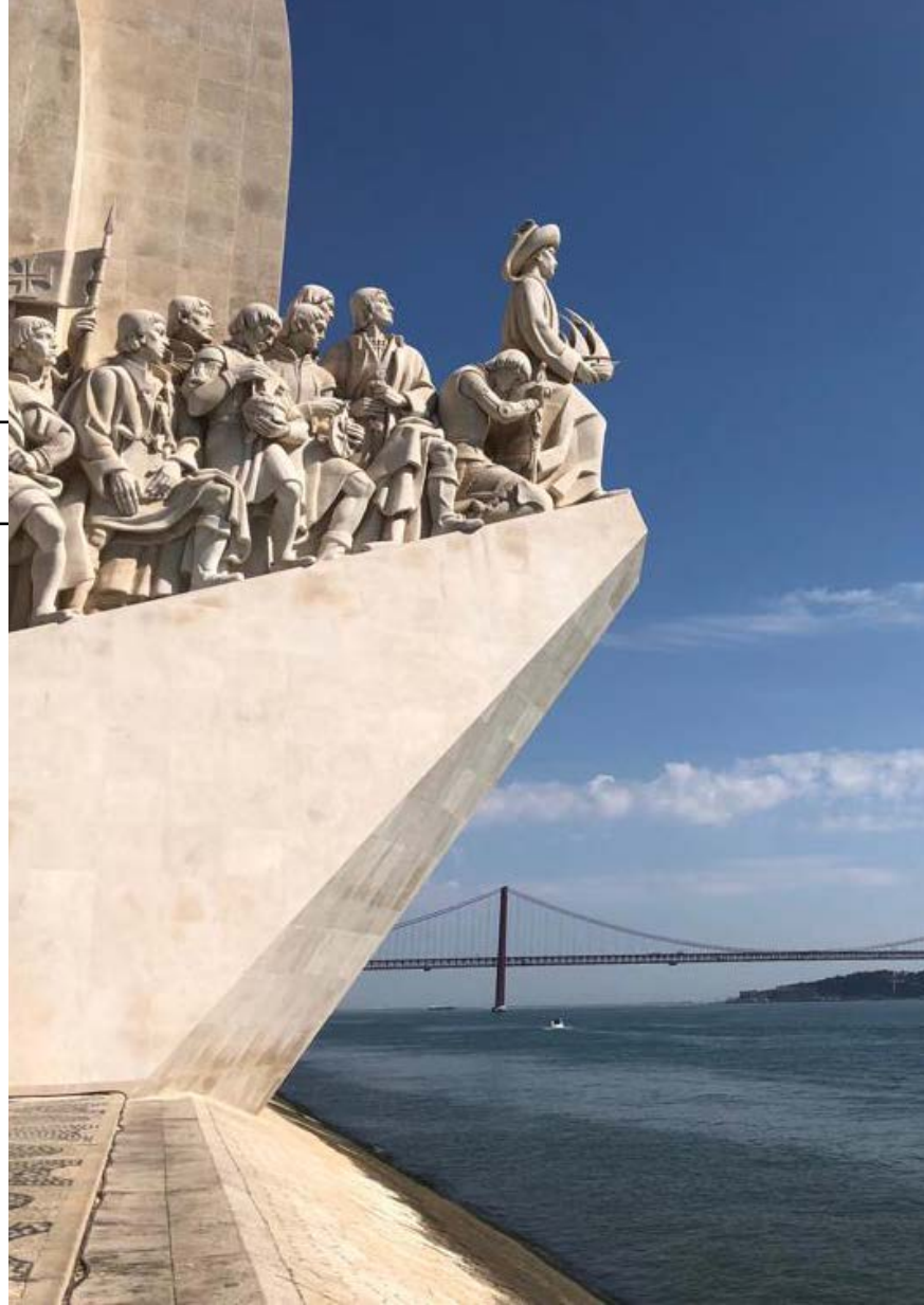
Denkmal der Entdeckungen | Lissabon

Zudem hat sich Portugals Wirtschaftszentrum Lissabon als neuer Standort der digitalen Welt etabliert und ist seit 2016 Standort der größten Internet-Technologie-Konferenz der Welt, der sogenannten „Web Summit“.