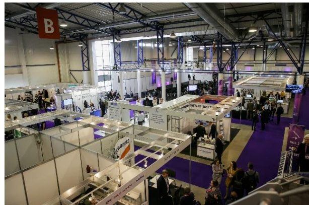
Auf der internationalen Ausstellung wurden die neuesten Technologien und Innovationen vorgestellt

50 Prozent der Präsentationen, die von verschiedenen europäischen, israelischen und amerikanischen Unternehmen ergänzt wurden.