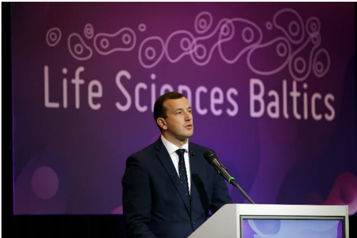
Zeichen der wachsenden Life Science Wirtschaft in Litauen (Virginijus Sinkevičius, Wirtschaftsminister)

Konferenz „Life Sciences Baltics 2018“ am 26.-27. September 2018 in Vilnius