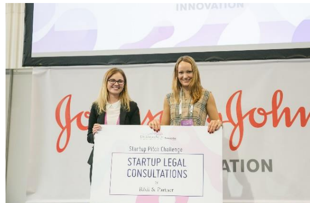
Das Start-up „Alternative Plants“ erhält von Rödl & Partner als Zweitplatziertes eine kostenlose Rechtsberatung

Investoren, Professoren und anderen Spezialisten aus dem Bereich der Life Science bewertet. Der Gewinner der Pitch Challenge erhielt ein einjähriges Mentorat von Johnson & Johnson Innovation und ein einwöchiges Lernprogramm von Akron BioMedical Corridor. Es war für Rödl & Partner eine große Freude, dem Zweitplatzierten eine kostenlose Rechtsberatung zur Unterstützung und Förderung des Start-ups zur Verfügung zu stellen.