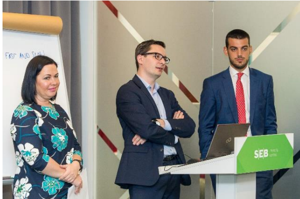
„Gemeinsam erfolgreich“ Rödl & Partner als Sponsor und Teil der LSB 2018

als Sponsor, Experte und Ansprechpartner für die Förderung und Entwicklung von Start-ups und jungen Unternehmen im Bereich Life Sciences dabei.