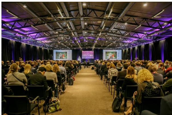
Industrieunternehmen, Wissenschaftler und Politiker präsentierten die Innovationen und Herausforderungen der Life Science

In insgesamt vier Konferenzhallen wurden ganztägig die Rolle der Digitalisierung und neuer Technologien zur Verbesserung des Gesundheitswesens thematisiert. Strukturell wurden Präsentationen zu größeren Themenkomplexen, wie z.B. die Digitalisierung zur Verstärkung der Gesundheitsversorgung, als auch in Themengebiete mit einzelnen nachfolgenden Präsentationen abgehalten, z.B. verschiedene Thematiken zu diagnostischen Technologien.