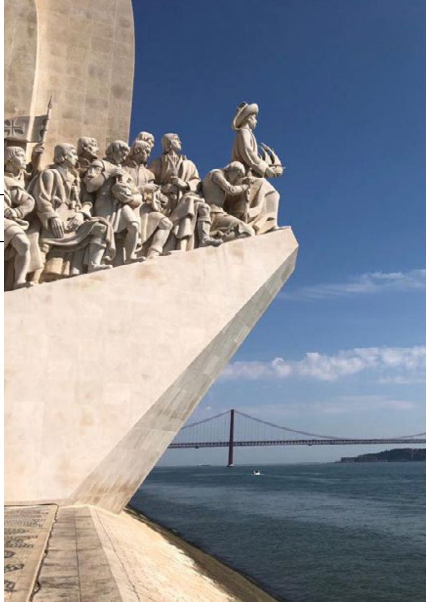
Denkmal der Entdeckungen | Lissabon

Zudem hat sich Portugals Wirtschaftszentrum Lissabon als neuer Standort der digitalen Welt etabliert und ist seit 2016 Standort der größten Internet-Technologie-Konferenz der Welt, der sogenannten „Web Summit“.